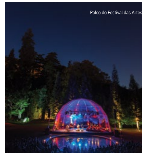
Palco do Festival das Artes

Concerto oferecido pela Caixa Geral de Depósitos